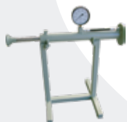
Dispositivo para Control de Operación