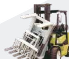
Inversor Empujador de Carga