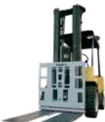
Empuja Tira Carga Push-Pull