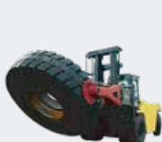
Pinza para Ruedas