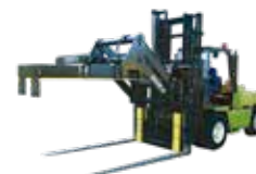
Fijador de Tubos