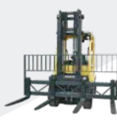
Placa Porta Horquillas