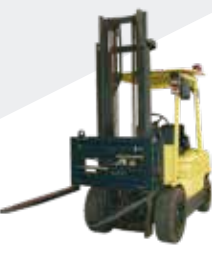
Posicionador de Horquillas