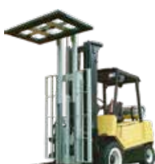
Fijador de Cargas