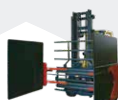
Pinzas para Electrodomésticos