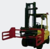
Pinza para Fardos