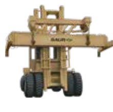
Spreader para Contenedores