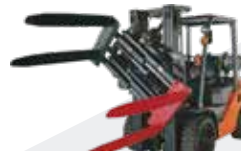
Inversor de Cargas