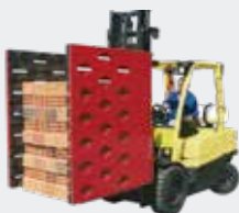
Pinza para Ladrillos, Tejas y Cerámicas