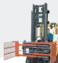
Pinzas para Cajas