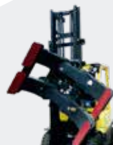
Pinza para Bobinas