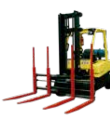
Posicionador Múltiple de Horquillas