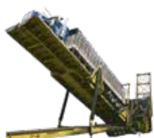
Plataforma de Descarga