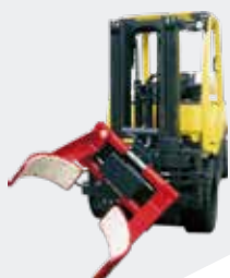
Pinza para Tambores